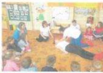
Ještě říká, že jsem měla starší tyčiny na Slovensku, je to pro mě velká zkušenost. Bylo to super, vůbec jsem se nemutily.

Všichni se sešli ve školní jídelně, kde byl malý stůl s občerstvením. Konečně se sešli. Budoucí zdravotnice z Uherského Hradiště se vydaly na Slovensko, aby se seznámily s novými metodami výuky a získaly zkušenosti z praxe. Do projektu je zapojena střední škola zdravotnická, jejíž učitelé a absolventky z Uherského Hradiště a Střední zdravotnické školy Skalica. Aktivita se odehrává ve dvou křídlech zhlazené ze starých budov zhruba před třiceti lety. Všechny mají svůj prostor, své učitelky, které se vyznačují ve stejném oboru a mohou si s nimi vyměnit své poznatky, zkušenosti a v neposlední řadě navázat nové přátelství. „Jsem